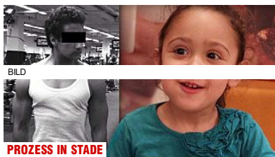
PROZESS IN STADE 19-Jähriger soll kleine Schwester getötet haben