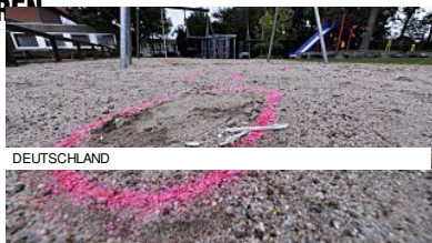
DEUTSCHLAND OSTFRIESLAND 16-Jähriger (10) schwer verletzt auf Spielplatz gefunden

( http://www.bild.de/regional/hamburg/prozesse/19-jaehriger-soll-kleine-schwester-getoetet-haben-37387878.bild.html ) ( http://www.bz-berlin.de/deutschland/maedchen-6-schwer-verletzt-auf-spielplatz-gefunden )